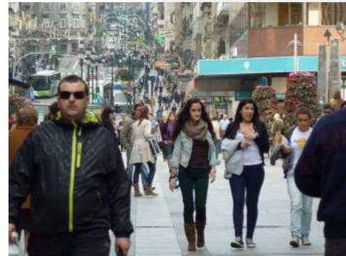
El centro urbano de Vigo, las calles Príncipe y Urzaiz, con miles de personas.

Según los datos definitivos sobre el estudio de población que acaba de publicar el Instituto Galego de Estadística (IGE), Vigo ha dado un salto social y de no tener apenas vecinos emigrantes a enviar fuera a 1.300 personas cada año, lo que supone un ritmo de un centenar cada mes o tres al día. El IGE indica que en 2006 habían cogido las maletas para salir de España 285 vigueses. En 2008 se multiplicó por cuatro esta cifra hasta llegar a 1.020, una cifra que se ha mantenido hasta 2011, subiendo hasta 1.292 en el último ejercicio. Y todo apunta a que no se quedará aquí visto que la recesión todavía durará mucho tiempo y las posibilidades de encontrar trabajo disminuyen. Buena parte de los residentes que han cambiado su domicilio a otro país son extranjeros, sudamericanos o rumanos y portugueses, los que con diferencia mayor movilidad han demostrado. Pero a su lado crece el número de jóvenes vigueses bien preparados que optan por buscar un horizonte lejos de la ciudad.