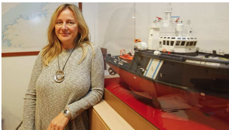
XOÁN A. SOLER (HTTP://WWW.LAVOZDEGALICIA.ES/FIRMAS/XOAN-ARIAS-SOLER).